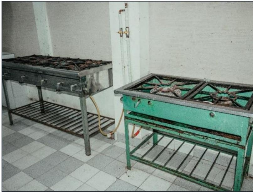
Ilustración 7. Zona de limpieza ubicada en el segundo espacio de operación de la planta de procesamiento de alimentos IEO Eugenio Díaz Castro