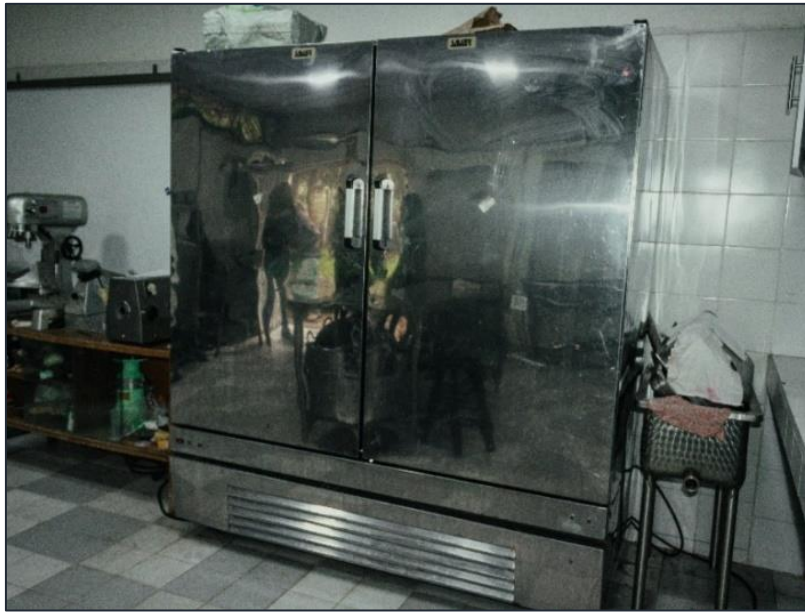
Ilustración 9. Zona de almacenamiento ubicada en el segundo espacio de operación de la planta de procesamiento de alimentos IEO Eugenio Díaz Castro