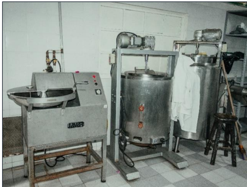
Ilustración 5. Equipos de operación ubicados en el segundo espacio de operación de la planta de procesamiento de alimentos IEO Eugenio Díaz Castro