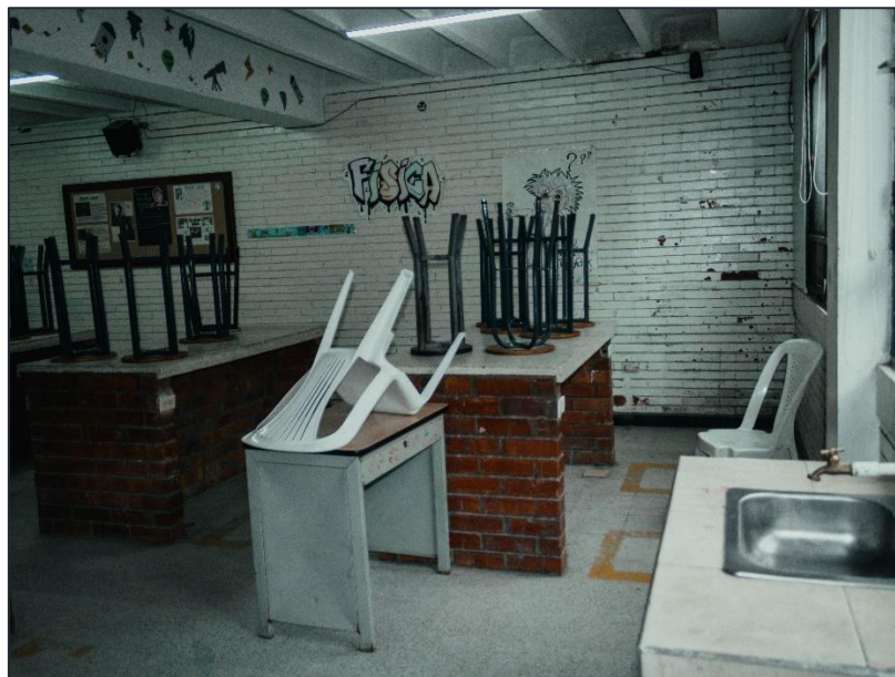
Ilustración 8. Laboratorio de física IEO Integrado de Soacha