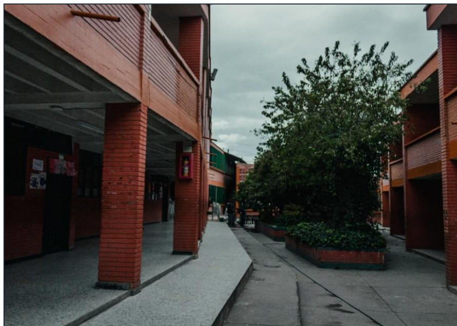
Ilustración 2. IEO Integrado de Soacha

A continuación, se muestran imágenes de soporte correspondientes a la sede antigua en la cual se localiza la planta de procesamiento de alimentos de la IE.