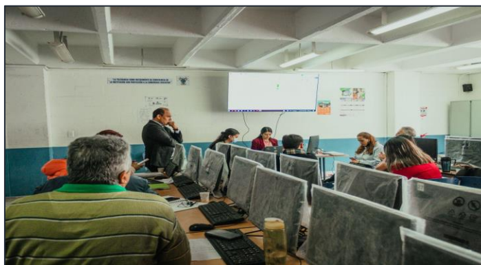
Ilustración 2. Sala de sistemas IEO Julio Cesar Turbay

A continuación, en las siguientes tres páginas se encuentran algunas imágenes que ilustran estos ambientes: