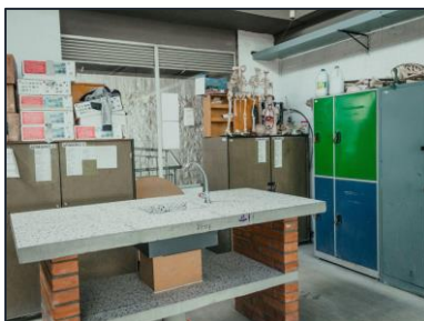
Ilustración 4. Sala de bilingüismo IEO Julio Cesar Turbay