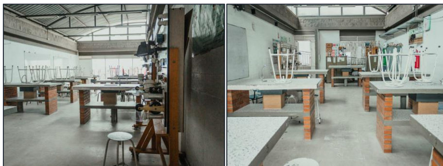
Ilustración 3. Salón de Ciencias Naturales con espacio para tecnología IEO Julio Cesar Turbay