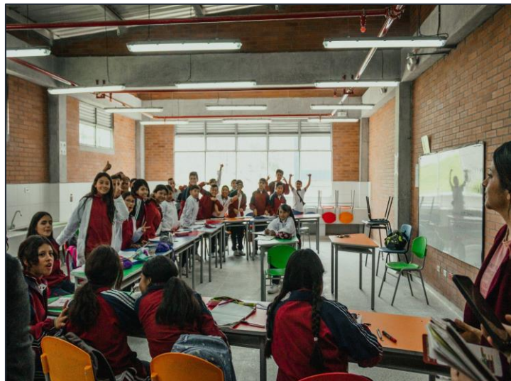
Ilustración 7. Laboratorio de Química IEO Julio Cesar Turbay