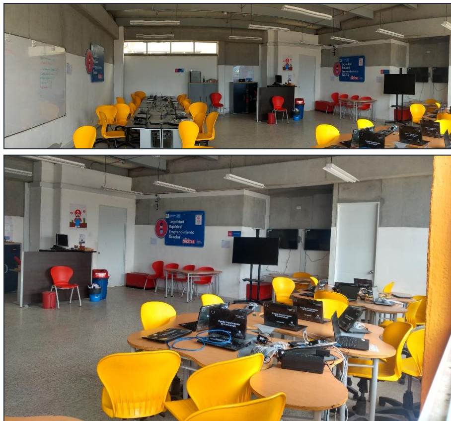
Ilustración 2: Aula Polivalente EBS y EM IEO Paz y Esperanza

A continuación, algunas imágenes que ilustran estos ambientes.