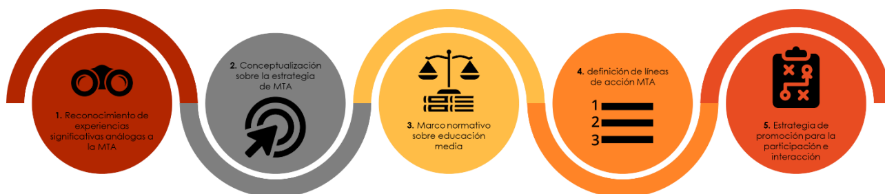
Ilustración 1. Fundamentación – líneas de acción

De este marco de referencia se derivaran las líneas de acción propuestas para la MTA, que a su vez serán compartidas a los distintos actores identificados y sobre las cuales se buscará de ellos, aportes y complementaciones sobre los focos que en cada línea se deben abordar como parte del plan de acción del 2023.