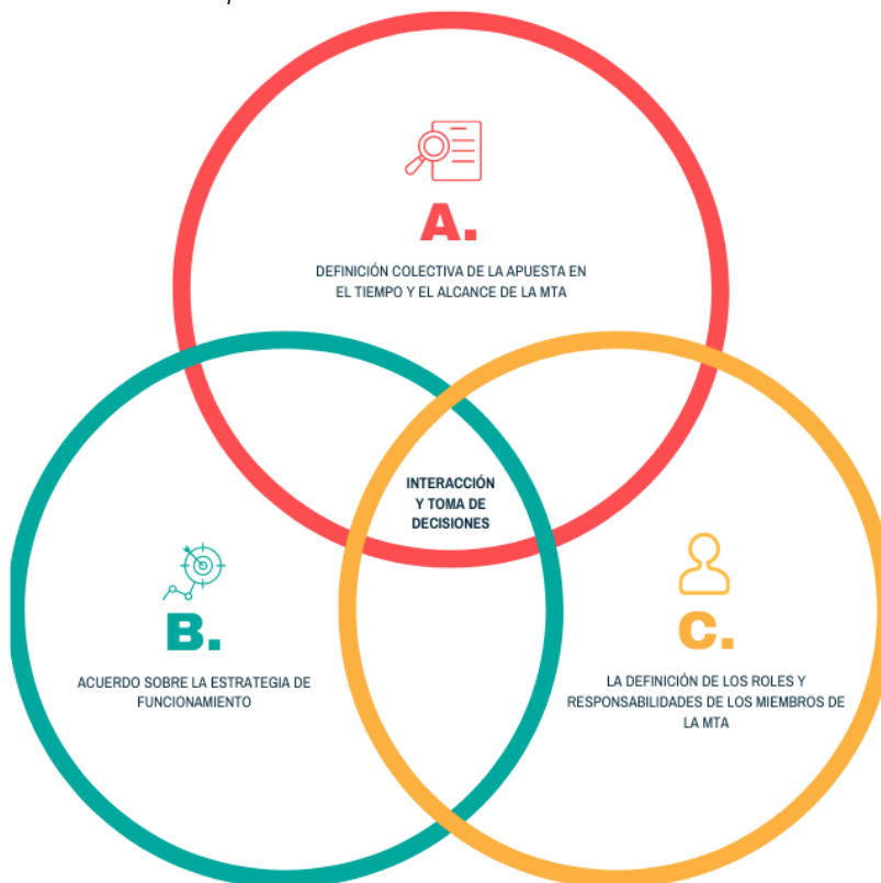
Ilustración 3. Aspectos valorados en los mecanismos de interacción

Para promover la interacción y los mecanismos con los cuales de los actores de la mesa actuarán, tomarán decisiones, retroalimentarán y aprovecharán lo acordado, es fundamental considerar el momento que antecede a su formalización, durante el cual se establecen acuerdos previos informales entre los actores y los sectores, en aras de un adecuado funcionamiento y dinámica para favorecer las intervenciones que realizará en la mesa, para ello se propone valorar: