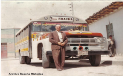
Archivo Soacha Histórica