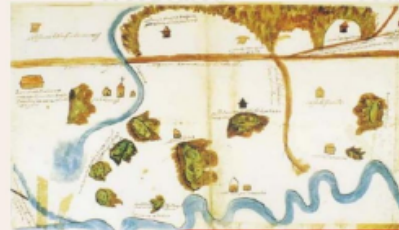
Soacha en su momento

En el año 1.600 como fecha de fundación del municipio, en este año por auto del visitador Luis Enríquez, fue instituido el municipio.