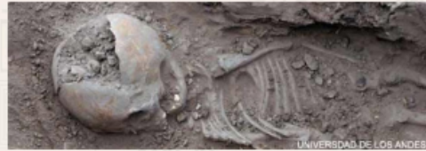
UNIVERSIDAD DE LOS ANDES

En la zona de la hacienda Tequendama se hallaron los restos de un hombre primitivo que data en más de doce mil años lo que lo convierte en el más antiguo de América.